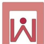
РЕГИОНАЛНИ ЦЕНТАР ЗА ТАЛЕНТЕ „МИХАИЛО ПУПИН“ ПАНЧЕВО