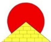
РЕГИОНАЛНИ ЦЕНТАР ЗА ТАЛЕНТЕ ЛОЗНИЦА